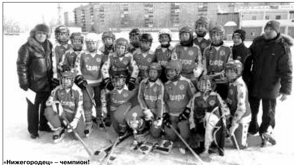
«Нижегородец» – чемпион!