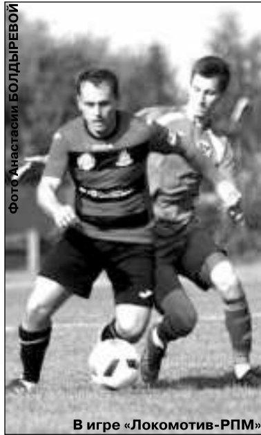
В игре «Локомотив-РПМ»