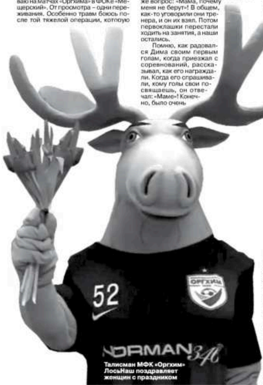
Талисман МФК «Оргхим» ЛосьНаш поздравляет женщин с праздником