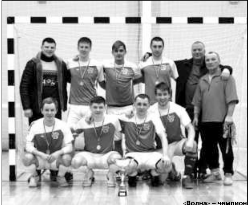
«Волна» — чемпион

Перед очной встречей соперники имели равное количество очков, но в решающем матче «Волна» не дала усомниться в своем превосходстве. Ковернинцы, к слову, одержали победы во всех без исключения встречах, лишь в одной из них им потом засчитали техническое поражение.