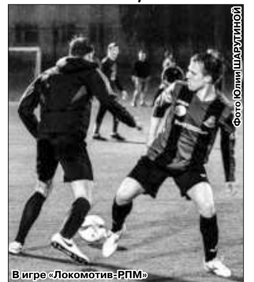
В игре «Локомотив-РПМ»