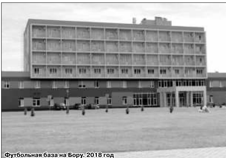
Футбольная база на Бору. 2018 год

Уругвай: М. Малло, Х. Малло, Сигабо, Стефано, Пичини, Кастро, Соуза, Сольсона, Вильяр, Лапера, Сивилья. Голы: 0:1 – Вильяр (2), 0:2 – Вильяр (25), 1:2 – В. Мещеряков (37), 1:3 – Сольсона (43), 1:4 – Вильяр (47), 2:4 – Н. Сметанин (58).