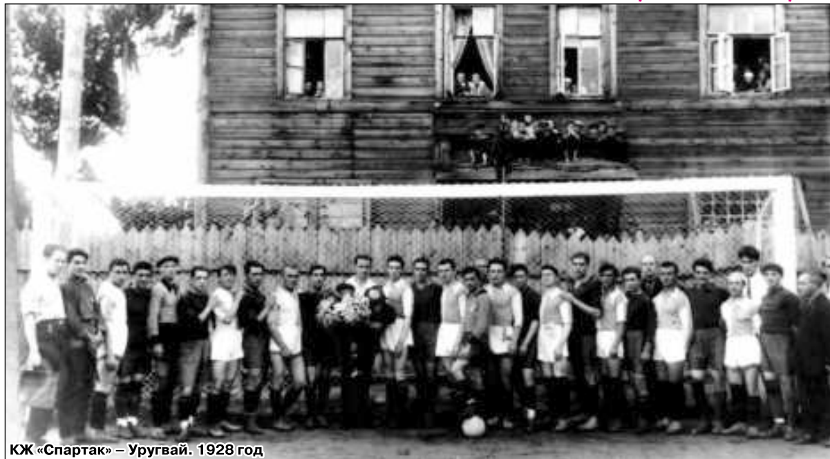
КЖ «Спартак» – Уругвай. 1928 год