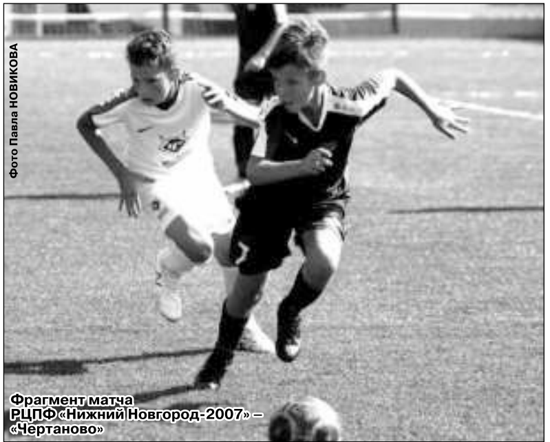
Фрагмент матча РЦПФ «Нижний Новгород-2007» — «Чертаново»