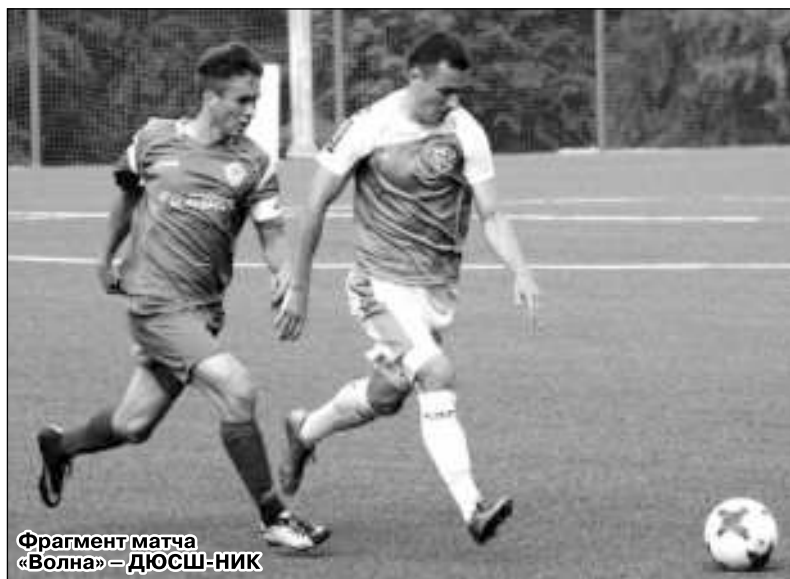
Фрагмент матча «Волна» – ДЮСШ-НИК